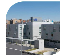
Hospital Viamed Santa Ángela de la Cruz