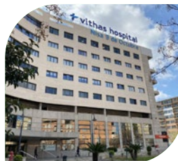
Hospital 9 de Octubre