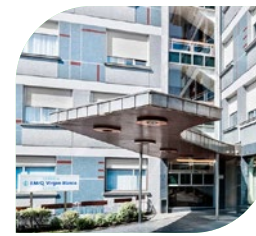
Clínica Virgen Blanca