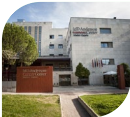
Hospital MD Anderson