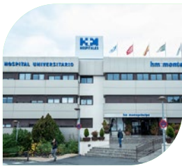
Hospital Madrid Montepíncipe

Cigna Healthcare pone a su disposición una de las redes de servicios médicos concertados más prestigiosa y extensa , con más de 49.650 especialistas y 1.942 hospitales y centros médicos en toda España.