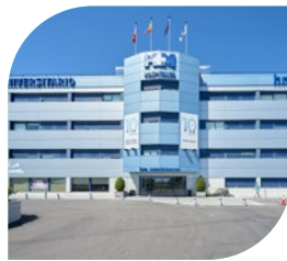
Hospital Madrid Norte Sanchinarro